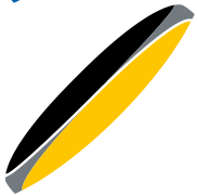
Farbvarianten Color combinations Couleurs